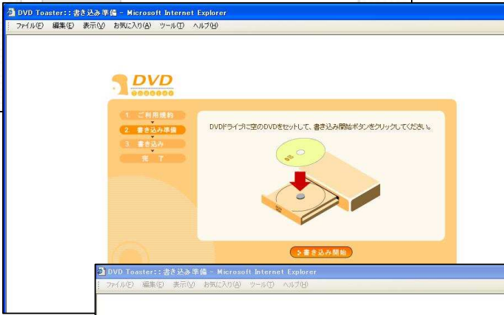
②DVD ドライブに 空の DVD をセット